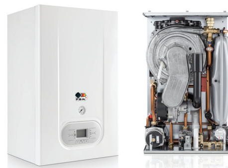
Mod. NOVAKOND 2K 25 RA