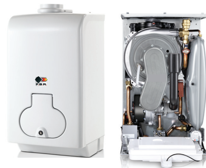
Mod. SKY NOVAKOND 2K 25 RA

A richiesta: sistema di controllo remoto a distanza e sonda esterna per regolazione climatica