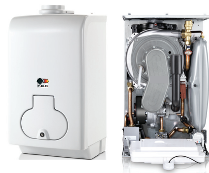
Mod. SKY NOVAKOND 1K 25 RA

A richiesta: sistema di controllo remoto a distanza e sonda esterna per regolazione climatica