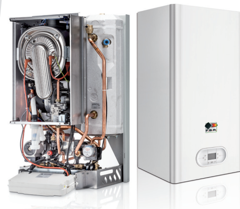
Mod. NOVAKOND 25 RAB