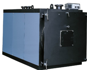
Mod. PRESS-T 3S 1100÷3600

CALDAIA + BRUCIATORE N.B. SENZA PANNELLO STRUMENTI*