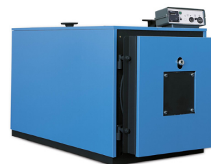
Mod. PRESS-T 3S 80+900