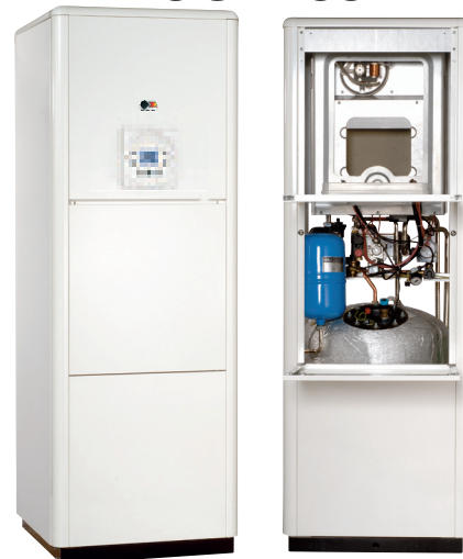
Mod. AURA P/ES 100 CE