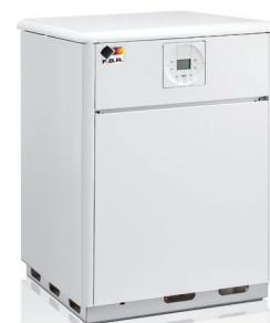
Mod. AURA P/ES 40 CE

A richiesta: sistema di controllo remoto a distanza e sonda esterna per regolazione climatica