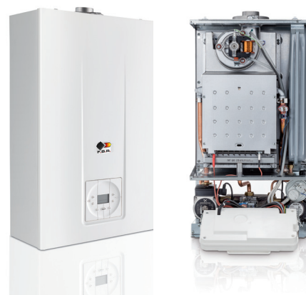
Mod. AURA/RAE 20 CE

A richiesta: sistema di controllo remoto a distanza e sonda esterna per regolazione climatica